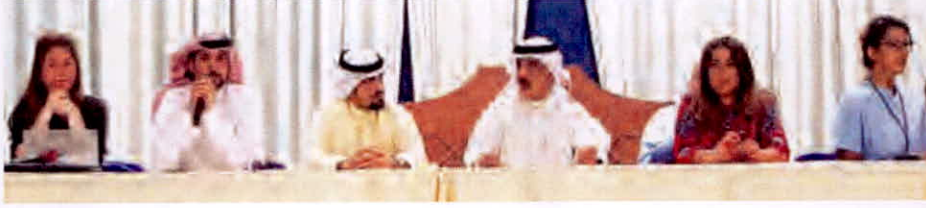
جانب من اللقاء التنويري