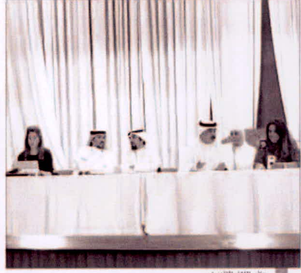
جانب اللقاء التنويرى

شرح نظام المكتبة وكيفية التسجيل فيه بما يخدم للتدريب خلال فترة الدراسة، وبعض النقاط التي تخص التدريب من الناحية الاجتماعية و توضيح بعض الأمور التي قد تواجههم خلال فترة الدراسة. كما تم التأكيد على الالتزام باللوائح والقوانين وآلية الدراسة في المعهد.